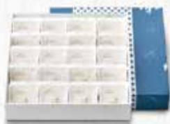
6332 軽羹20枚入 税込 5,832円 (本体5,400円)1.4kg