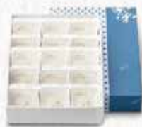
6331 軽羹15枚入 税込 4,374円 (本体4,050円)1.0kg