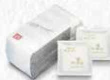
6217 軽羹5枚入(簡易) 税込 1,350円 (本体1,250円)0.32kg