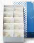
6330 軽羹10枚入 税込 2,970円 (本体2,750円)0.7kg